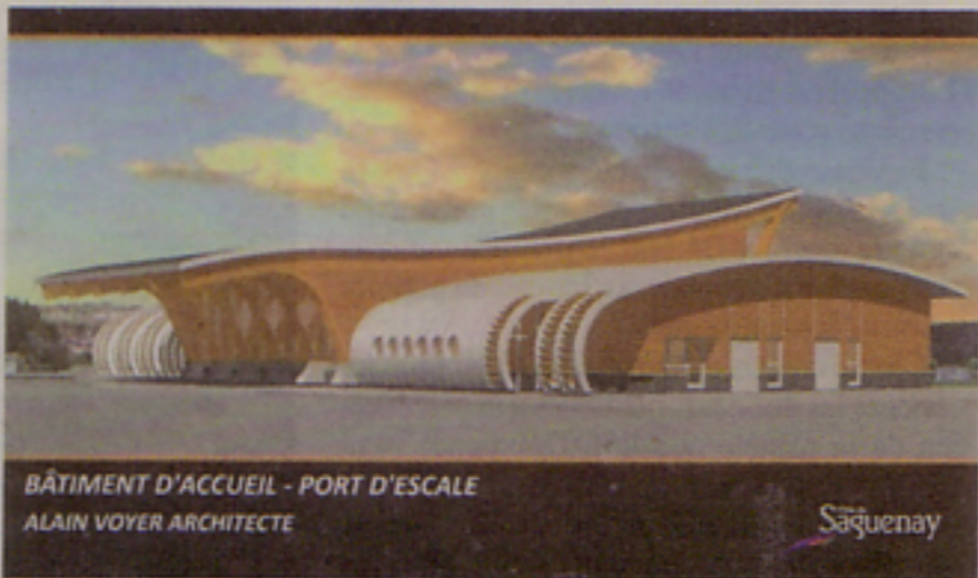
BÂTIMENT D'ACCUEIL - PORT D'ESCALE ALAIN VOYER ARCHITECTE