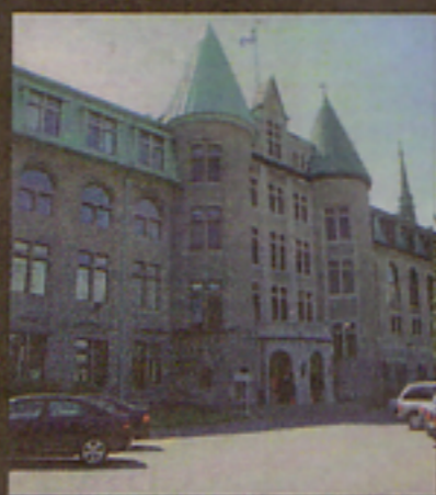
D'importants travaux seront réalisés au Collège de Valleyfield.

Pour sa part, le député Stéphane Billette a ajouté : «Les infrastructures collégiales doivent demeurer attrayantes et sécuritaires si nous voulons que les jeunes aient le goût de persévérer et de réussir.» (N.M)